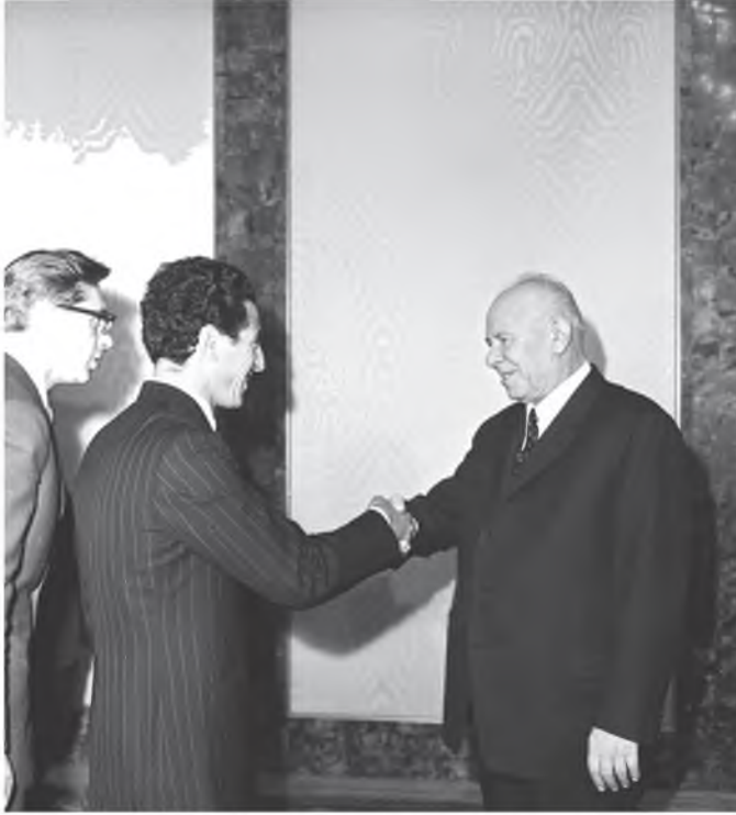
جانب من استقبال نيكولاي بودغورني نائب رئيس المجلس الأعلى لاتحاد الجمهوريات الاشتراكية السوفياتية في الكرملين لعبد السلام جلود، الاتحاد السوفياتي، 1 / 3 / 1972.